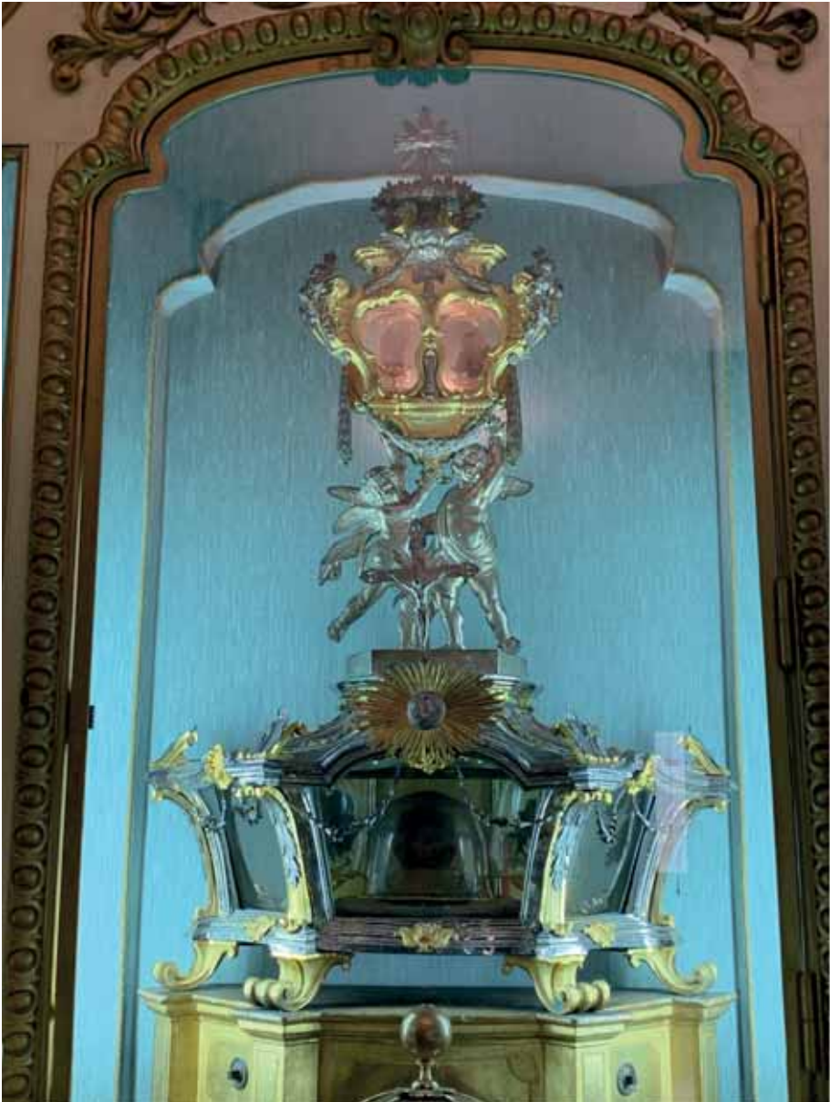
Fig. 10: Angelo Spinazzi, Tomasso Politi. Reliquario del Beato Giuseppe Calasanzio . Vista totale. Roma, Casa Generalizia dei Padri Scolopi. Capella delle Reliquie.