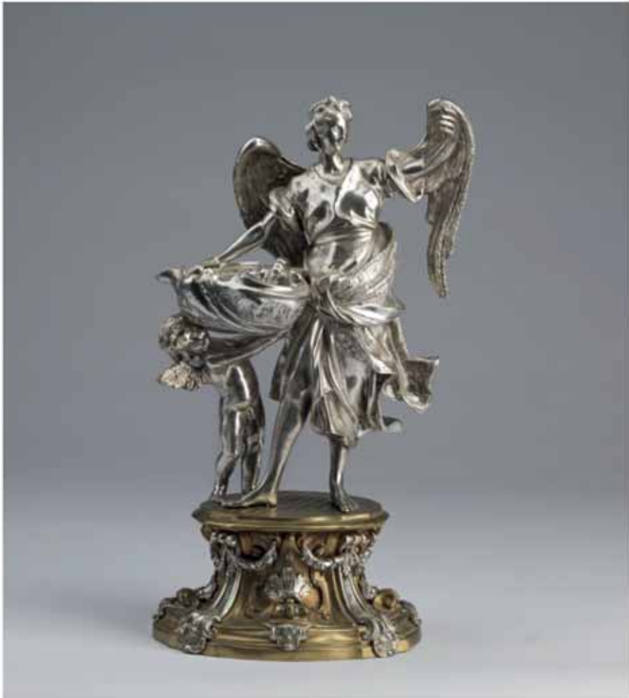
Fig. 3 Angelo Spinazzi, acquasantiera in argento a forma di angelo con putto reggente una conchiglia , già Capitolium