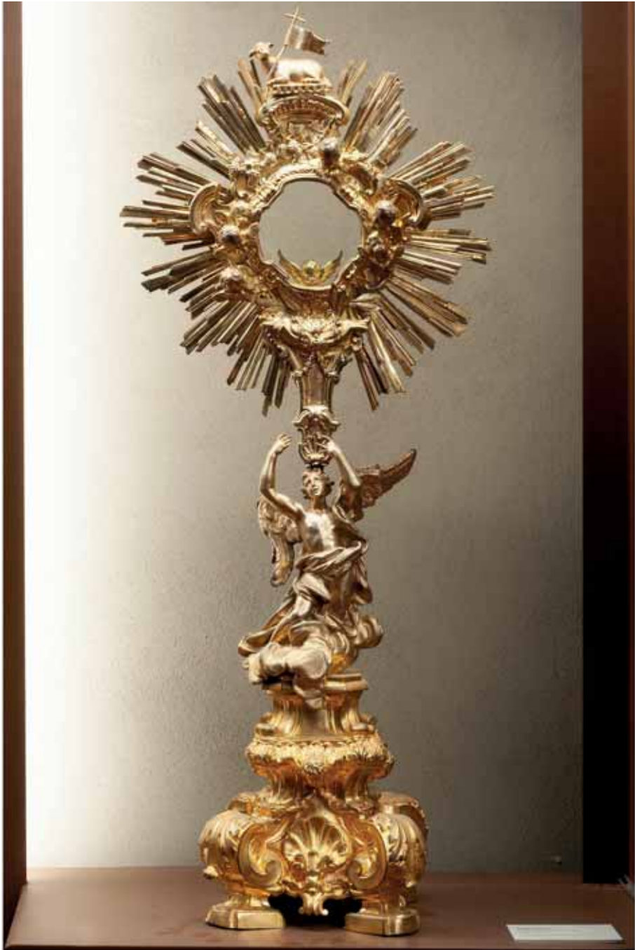
Fig. 5 Angelo Spinazzi, pedistallo con mostra di ostensorio e stauroteca , Piacenza, Museo della Cattedrale