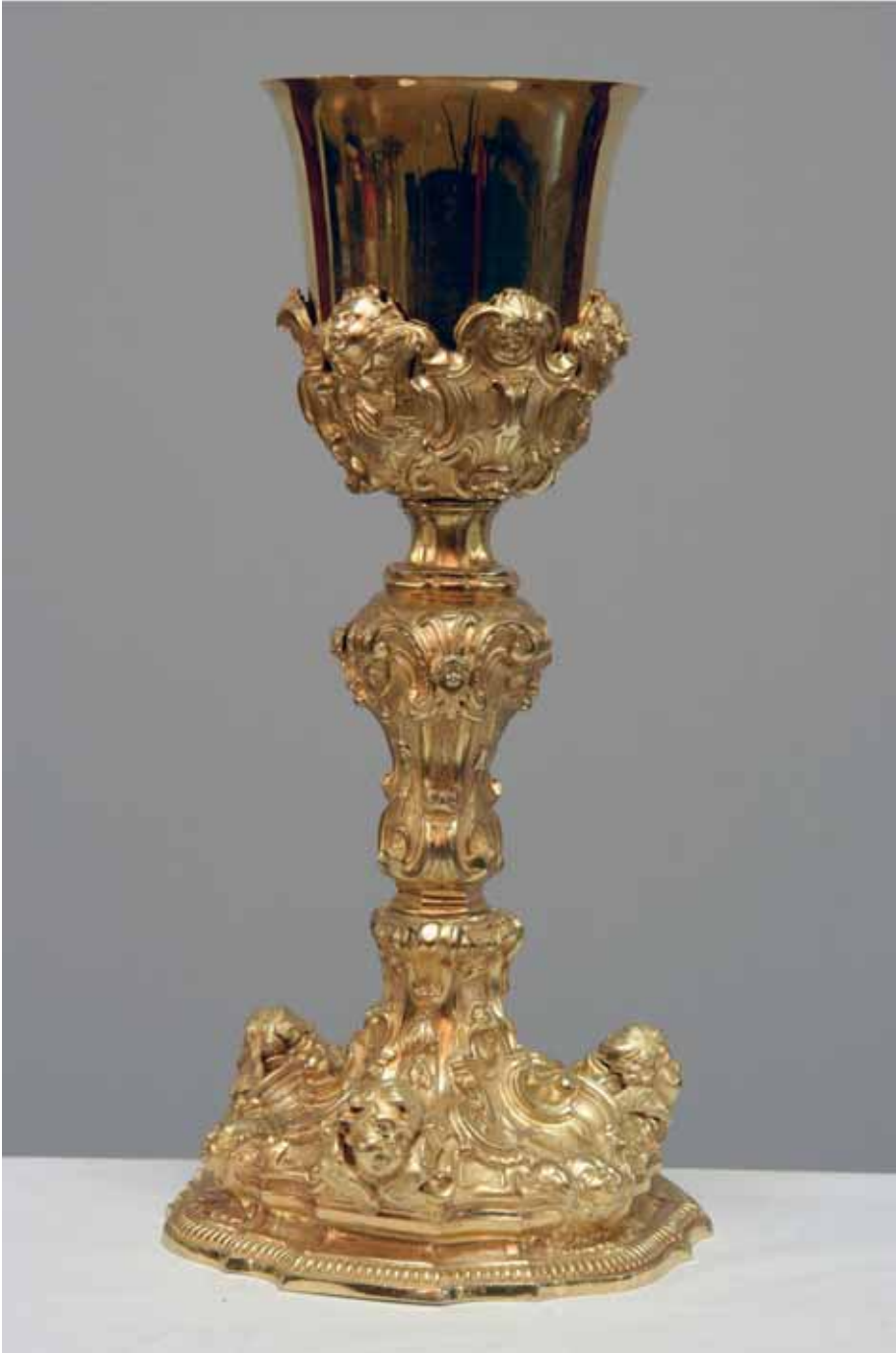
Fig. 6 Angelo Spinazzi, calice , Piacenza, Museo della Cattedrale