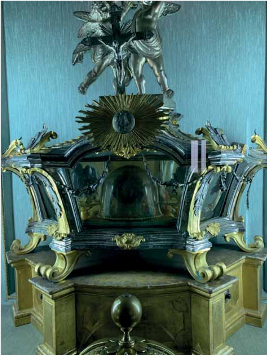
Fig. 8 Tommaso Politi, Reliquiario del Beato Giuseppe Calasanzio , Roma, Cappella delle Reliquie, Casa Generalizia degli Scolopi