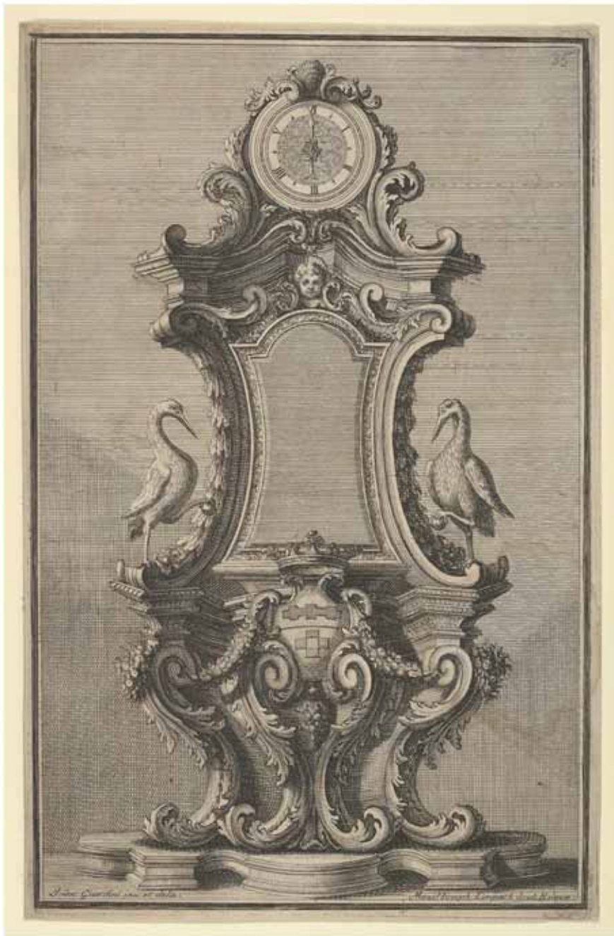
Fig. 2 Giovanni Giardini, progetto per un orologio , Disegni diversi , Roma, 1714