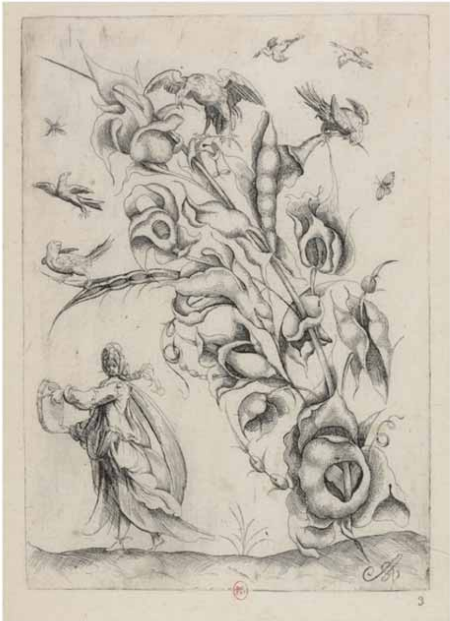
Fig. 1 Alexandre Vivot, stampa cosse de pois , Parigi, 1623.