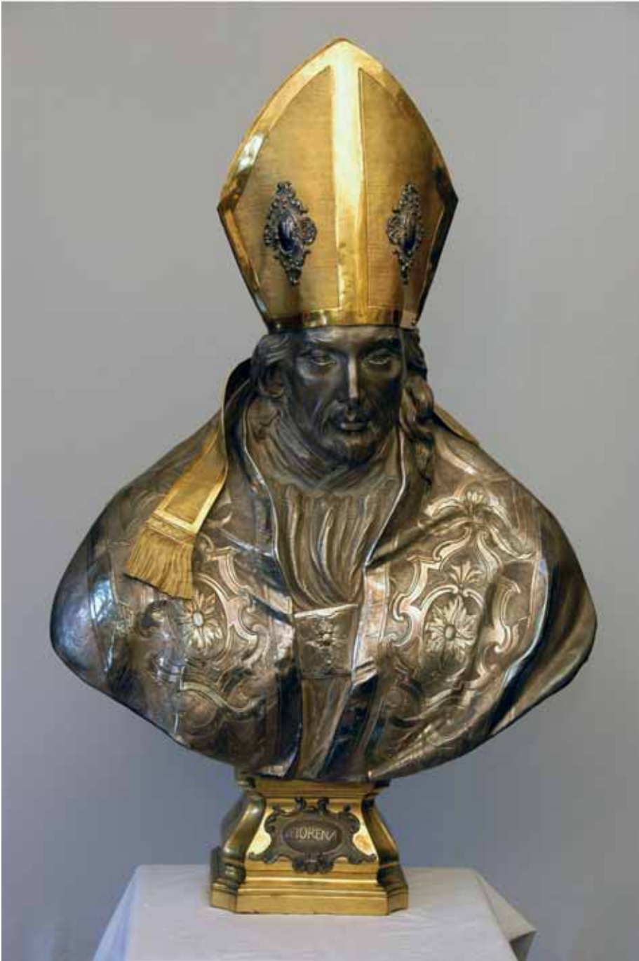
Fig. 4 Angelo Spinazzi, busto di San Fiorenzo , Fiorenzuola d'Arda, Collegiata