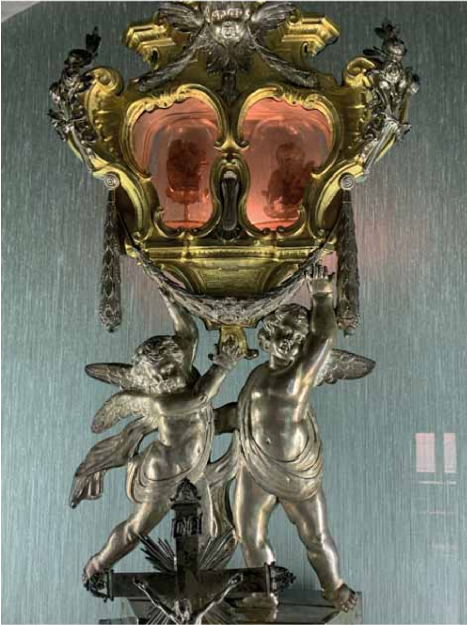
Fig. 9 Angelo Spinazzi, Reliquiario del Beato Giuseppe Calasanzio , Roma, Cappella delle Reliquie, Casa Generalizia degli Scolopi