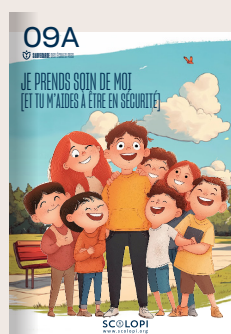
09A Je prends soin de moi [Et tu m'aides à être en sécurité]