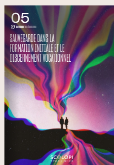
05 Sauvegarde dans la formation initiale et le discernement vocationnel