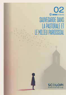
02 Sauvegarde dans la pastorale et le milieu paroissial