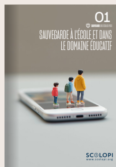
01 Sauvegarde à l'école et dans le domaine éducatif