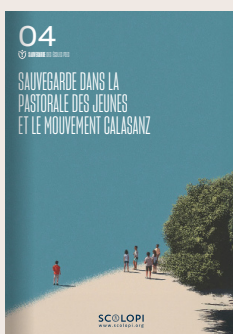
04 Sauvegarde dans la pastorale des jeunes et le Mouvement Calasanz