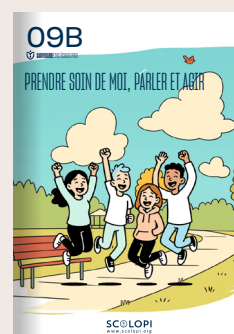
09B Prendre soin de moi, parler et agir