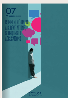
07 Comment répondre aux révélations, soupçons et accusations