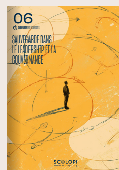
06 Sauvegarde dans le Leadership et la Gouvernance