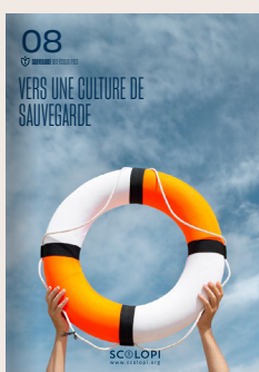
08 Vers une culture de sauvegarde