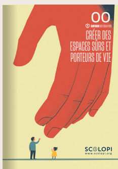
00 Créer des espaces sûrs et porteurs de vie