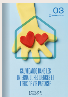
03 Sauvegarde dans les internats, résidences et lieux de vie partagée