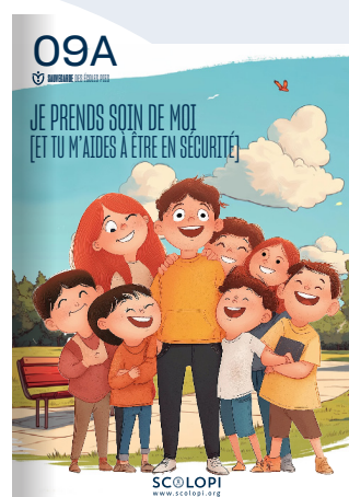
09A Je prends soin de moi [Et tu m'aides à être en sécurité]