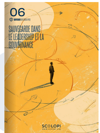
06 Sauvegarde dans le Leadership et la Gouvernance