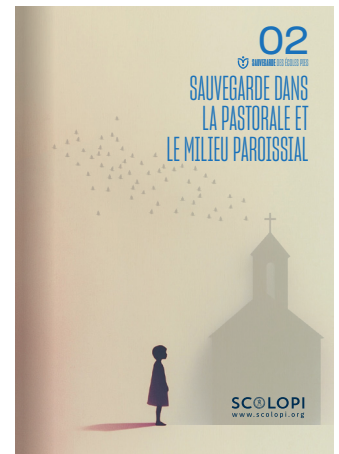
02 Sauvegarde dans la pastorale et le milieu paroissial