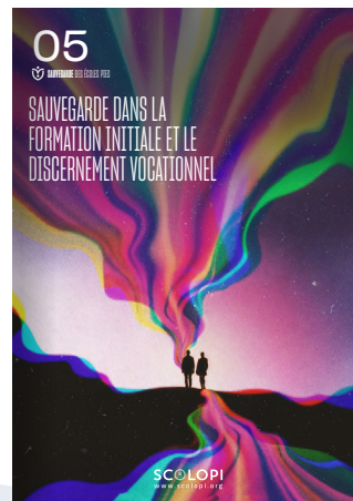
05 Sauvegarde dans la formation initiale et le discernement vocationnel