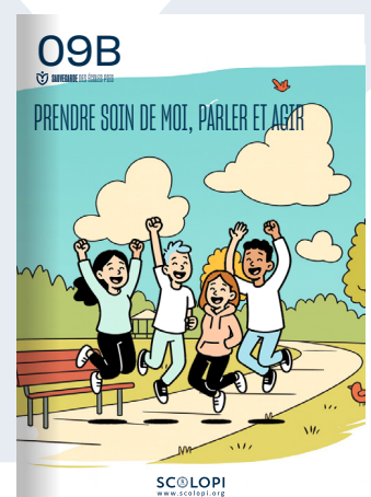
09B Prendre soin de moi, parler et agir