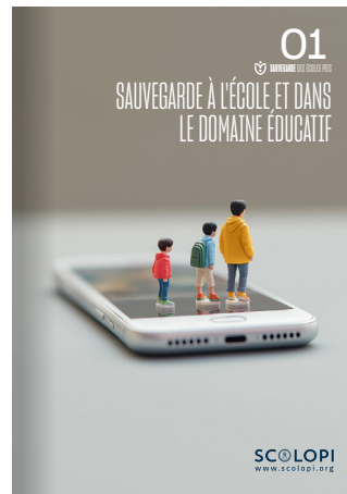
01 Sauvegarde à l'école et dans le domaine éducatif