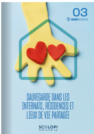
03 Sauvegarde dans les internats, résidences et lieux de vie partagée