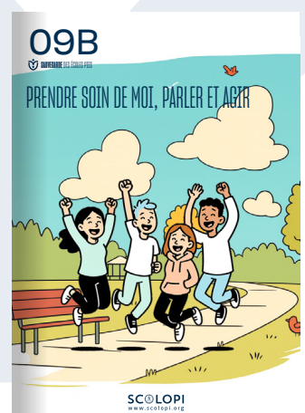
09B Prendre soin de moi, parler et agir