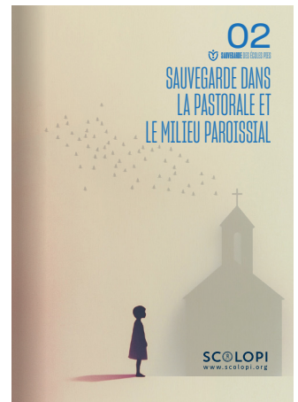
02 Sauvegarde dans la pastorale et le milieu paroissial