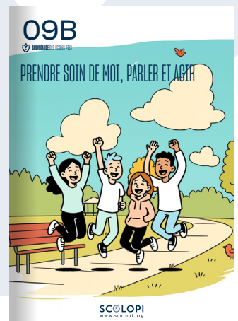
09B Prendre soin de moi, parler et agir