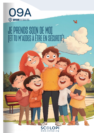
09A Je prends soin de moi [Et tu m'aides à être en sécurité]