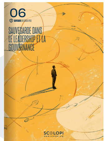
06 Sauvegarde dans le Leadership et la Gouvernance