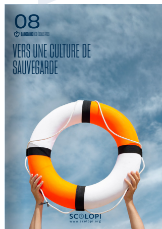
08 Vers une culture de sauvegarde