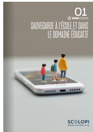
01 Sauvegarde à l'école et dans le domaine éducatif