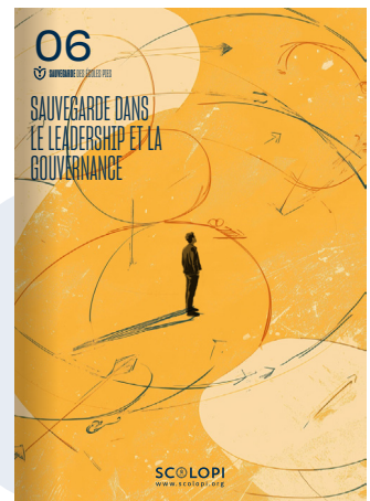
06 Sauvegarde dans le Leadership et la Gouvernance