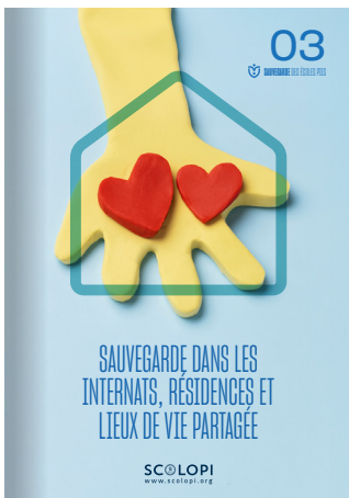
03 Sauvegarde dans les internats, résidences et lieux de vie partagée