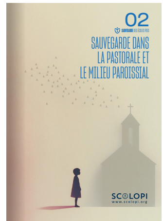
02 Sauvegarde dans la pastorale et le milieu paroissial