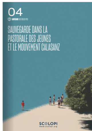
04 Sauvegarde dans la pastorale des jeunes et le Mouvement Calasanz