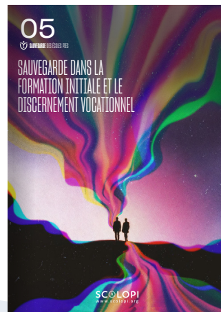
05 Sauvegarde dans la formation initiale et le discernement vocationnel