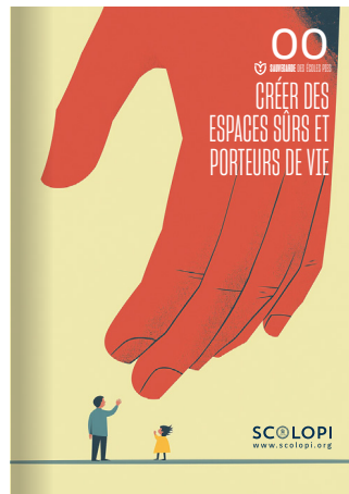
00 Créer des espaces sûrs et porteurs de vie

Série de guides utiles sur la protection et la sauvegarde des enfants dans les différents domaines de la mission piariste