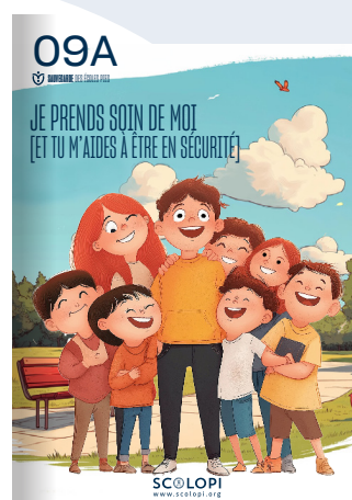
09A Je prends soin de moi [Et tu m'aides à être en sécurité]