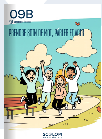
09B Prendre soin de moi, parler et agir