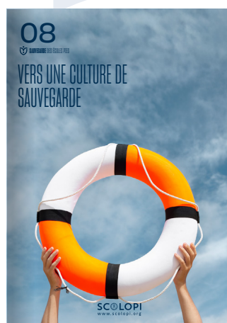
08 Vers une culture de sauvegarde